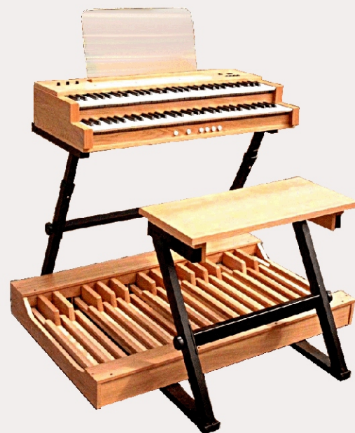
Musteraufbau einer zweimanualigen Blockorgel mit SP-30, ST-M und OB-M

© 2005 HOFFRICHTER Salzwedel Alle Spezifikationen freibleibend. Änderungen vorbehalten. B206-0105D003